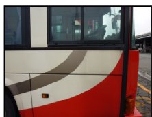
〈大型車の側面ガラス〉