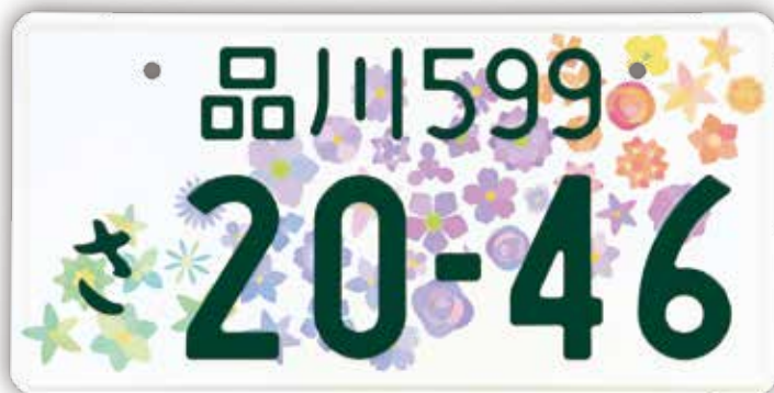
登録自動車(自家用)