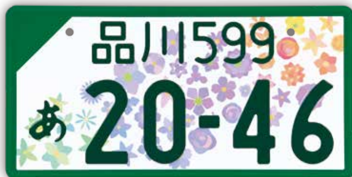
登録自動車(事業用)