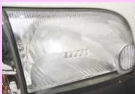
内部リフレクタの劣化