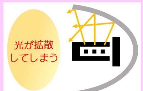
相性の悪いバルブに交換